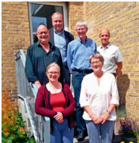
Organistforeningens bestyrelse fotograferet i sommeren 2018

(”Ekstraordinære” medlemmer omfatter også medlemmer, der ikke er i job, men som betaler ordinære kontingenter)